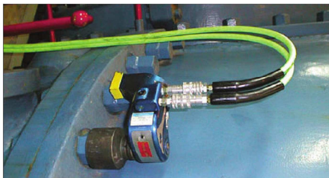
MXT-1型による大型車両組み立て